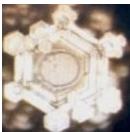
Molécula de água após exposição à música de Bach

No caso específico da música, as amostras foram expostas por horas entre dois alto-falantes. Num momento com músicas de Beethoven, Bach ou Mozart, noutro com Heavy Metal. Pode-se imaginar os resultados obtidos! Depois do congelamento as fotografias revelaram fantásticas variações. Formas divinas, esculpidas geometricamente pela força da música revelaram singular beleza hexagonal quando expostas aos mestres da música clássica. Já ao Heavy Metal, desvendaram formações distorcidas, disformes e descoloridas.