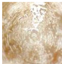
Molécula de água após exposição ao Heavy Metal