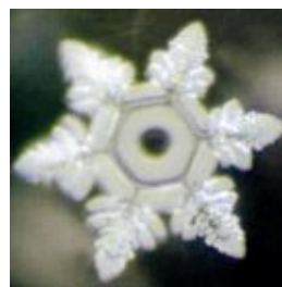
Molécula de água exposta a um grupo vibrando amor (hado)

A água, fonte de toda a vida da Terra, envia-nos sua mensagem solene e silenciosa confirmando ser sensível, como tudo que existe. Cada célula, nosso corpo físico, todo o planeta com suas constituições aquosas por excelência demonstram-se impressionáveis, comovíveis, suscetíveis aos mais simples sentimentos, à mais singela canção.