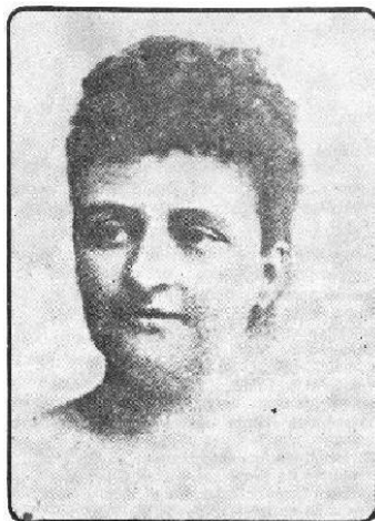
Close – Up de Mrs. Elgier Córner, ex-Miss Florence Cook, nos últimos anos de vida. E uma foto rara.

Há muito tempo Miss Florence Cook, Sir William Crookes e o Espírito Katie King vêm exercendo incontável fascínio sobre nós.