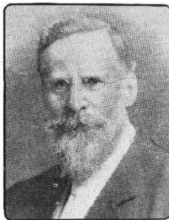
Sir William Crookes

Este livro, de per si difícil e exigindo incansável pesquisa, não estaria completo, nem seria entendível, por parte do leitor, se não apresentarmos ao menos um esboço de quem foi Sir William Crookes e de sua heróica participação na maior aventura psíquica de que se tem notícia. Nele têm papéis relevantes uma menina de 15 anos de idade, - Florence Cook, um dos maiores cientistas de seu tempo, - Sir William Crookes, e nada mais nada menos do que um Espírito, - Katie King.