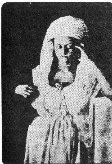
Detalhe de Katie King, separada da foto em que é vista com Sir William Crookes.

Admitindo mesmo que tal fato se tivesse dado, a diminuição da resistência ter-se-ia posto em evidência, imediatamente, pela agulha do galvanômetro. Nas experiências de que se trata foi evidentemente demonstrado que Miss Cook estava no gabinete enquanto Katie King se mostrava fora dele.