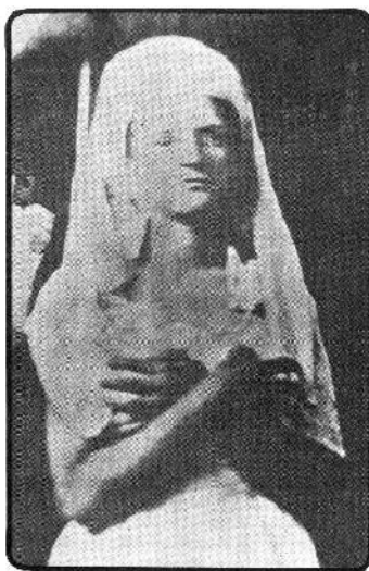
O Espírito Katie King fotografado enquanto se materializava

A despedida foi tão patética como se a morte nos devesse separar. Katie parecia não querer deixar-nos. Saiu para ver-nos, pela última vez, ocupando-se principalmente de Mr. W. Crookes, a quem dedicava grande amizade. Depois desapareceu para sempre e nunca mais tornou a ser vista.