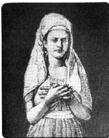
Katie King. Foto prejudicada por muitas reproduções.

"Para iniciar a sessão, pusemo-nos a cantar, como era costume. As luzes foram diminuídas de modo que nos pudéssemos ver nitidamente como, aliás, a tudo o que pudesse ter ocorrência na sala. Assim que a médium entrou em transe, surgiram, por uma abertura nas cortinas, que constituíam o gabinete, em sua parte mais alta, duas mãos com as quais Katie nos deu a entender que já estava presente. Pouco depois as cortinas se abriram deixando passar a forma completa do Espírito, vestido de gaze branca e que todos pudemos ver.