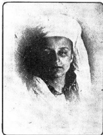
Close – Up do Espírito tomado em uma de suas rápidas aparições

de canalização vantajosa" (1885). Traduziu para o inglês o "Tratado de Metalurgia" de Kel, a obra de Riemann intitulada: "A anilina e seus derivados, assim como o livro de Wagner, "Tecnologia química" e a de Tille sobre os adubos artificiais. (Noveau Larousse Illustré).